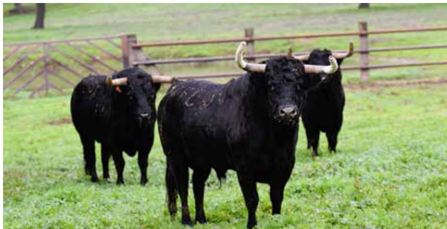
Toros de la ganadería Zalduendo

Accede con tu móvil a la noticia de Canal Norte Digital